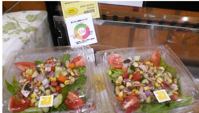
サラダのチカラを表すわかりやすいグラフも

人参ドレッシング、豆乳シーザードレッシング、 セロリアーモンドミルクドレッシング、 柚子と生姜のドレッシング、 エスニックドレッシング ルバーブドレッシング、梅トマトドレッシングなど