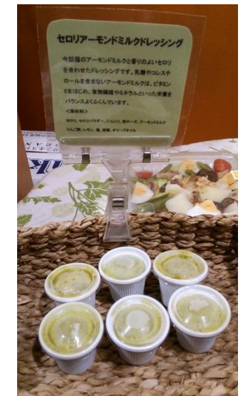
セロリアーモンドドレッシング